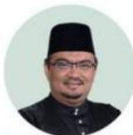
YB DATO' DR. MOHAMED FADZLI BIN DATO' HJ. HASSAN

PAS sedia menerima Parti Amanah Negara pada bila-bila masa sekiranya bersetuju mengikut syarat-syarat yang ditetapkan. Adakah UMNO sanggup membuat keputusan sebagaimana PAS, kepada Parti Bersatu atas dasar kepentingan umat Islam dan negara.